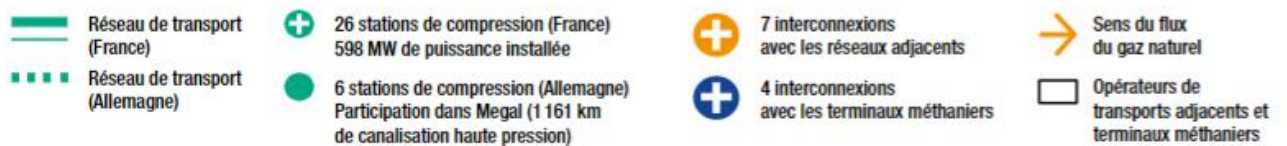
Figure n° 1 : Carte du réseau de transport de gaz naturel GRTgaz et points d'approvisionnement